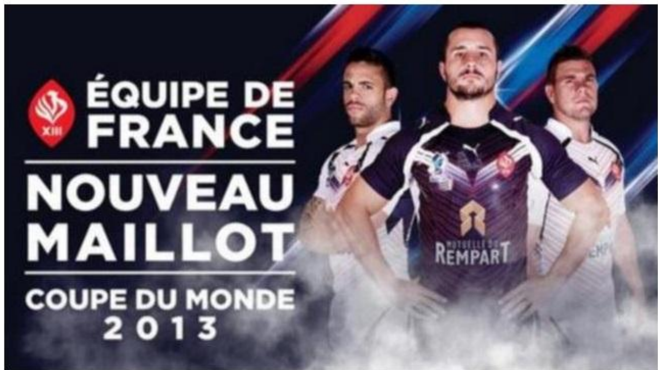
XIII de France : un nouveau maillot pour le Mondial.

Publié le 24-09-2013 à 15h00 - Mis à jour le 24-09-2013 à 15h00 // Par Clément Suman