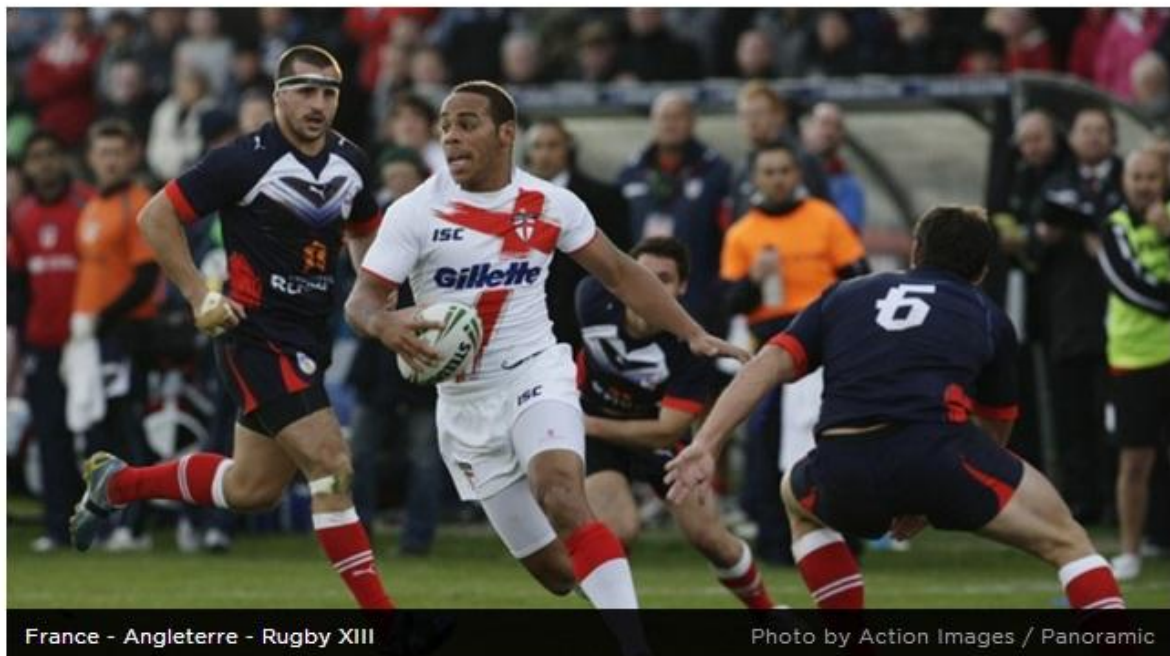
France - Angleterre - Rugby XIII