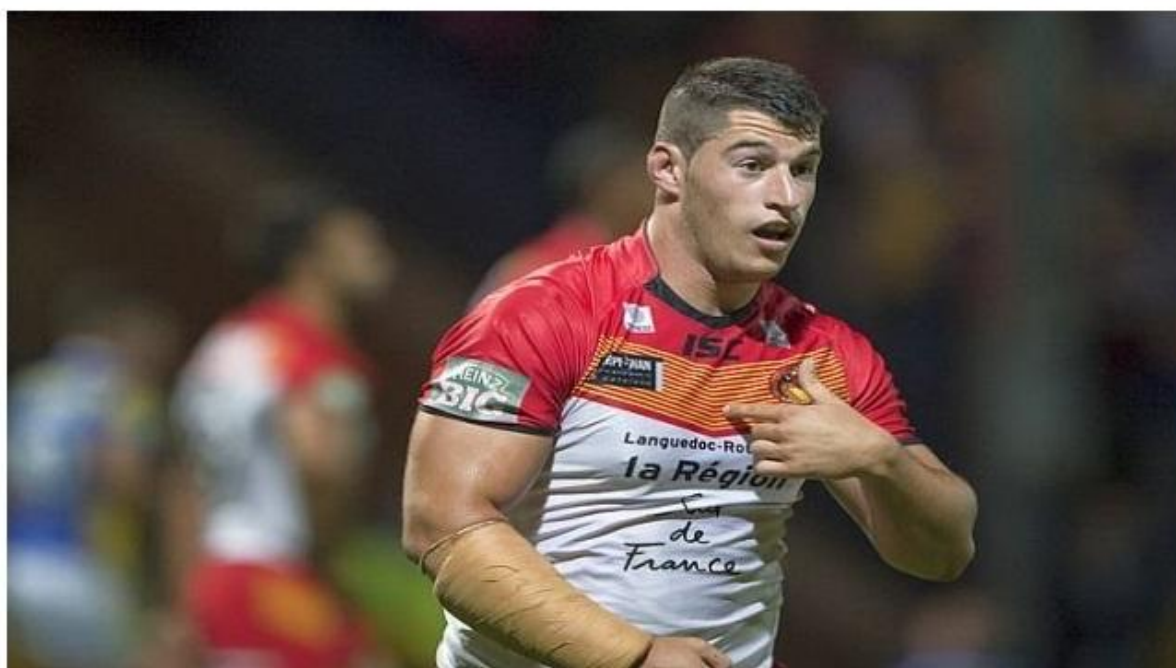
© dragons catalans Benjamin Garcia - Dragons Catalans de Perpignan - archives

Par Fabrice Dubault | Publié le 07/10/2013 | 17:14, mis à jour le 07/10/2013 | 17:14